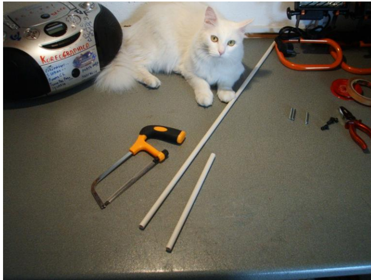
Il gatto non fa parte del materiale, ma mi faceva da consulente al cantiere 😊

Innanzitutto tagliate il tubo a misura di 75 cm (potete fare qualsiasi misura vogliate, io ho provato così)